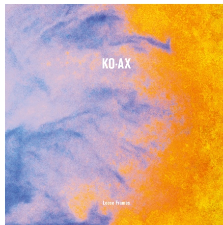
Album „Loose Frames“ (2017, Freifeld Tonträger)