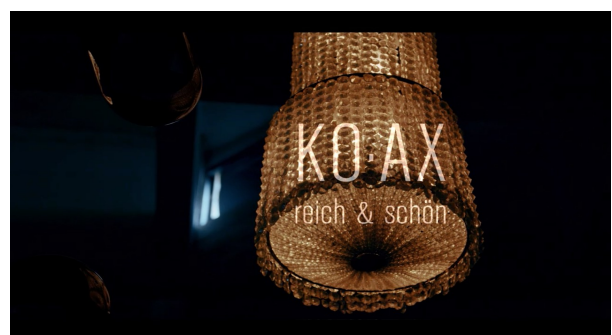
Live Recording Sessions aus dem Treibhaus Innsbruck (2022)